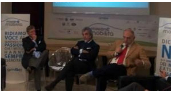
Un momento dell'evento Missione Mobilità